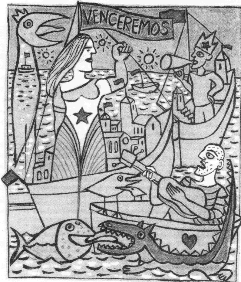
Venceremos von Thomas Richter aus „Lob des Kommunismus“

des, die für die Herrschenden in den USA von Kuba ausgeht, besteht darin, dass es eine gesellschaftliche Al-